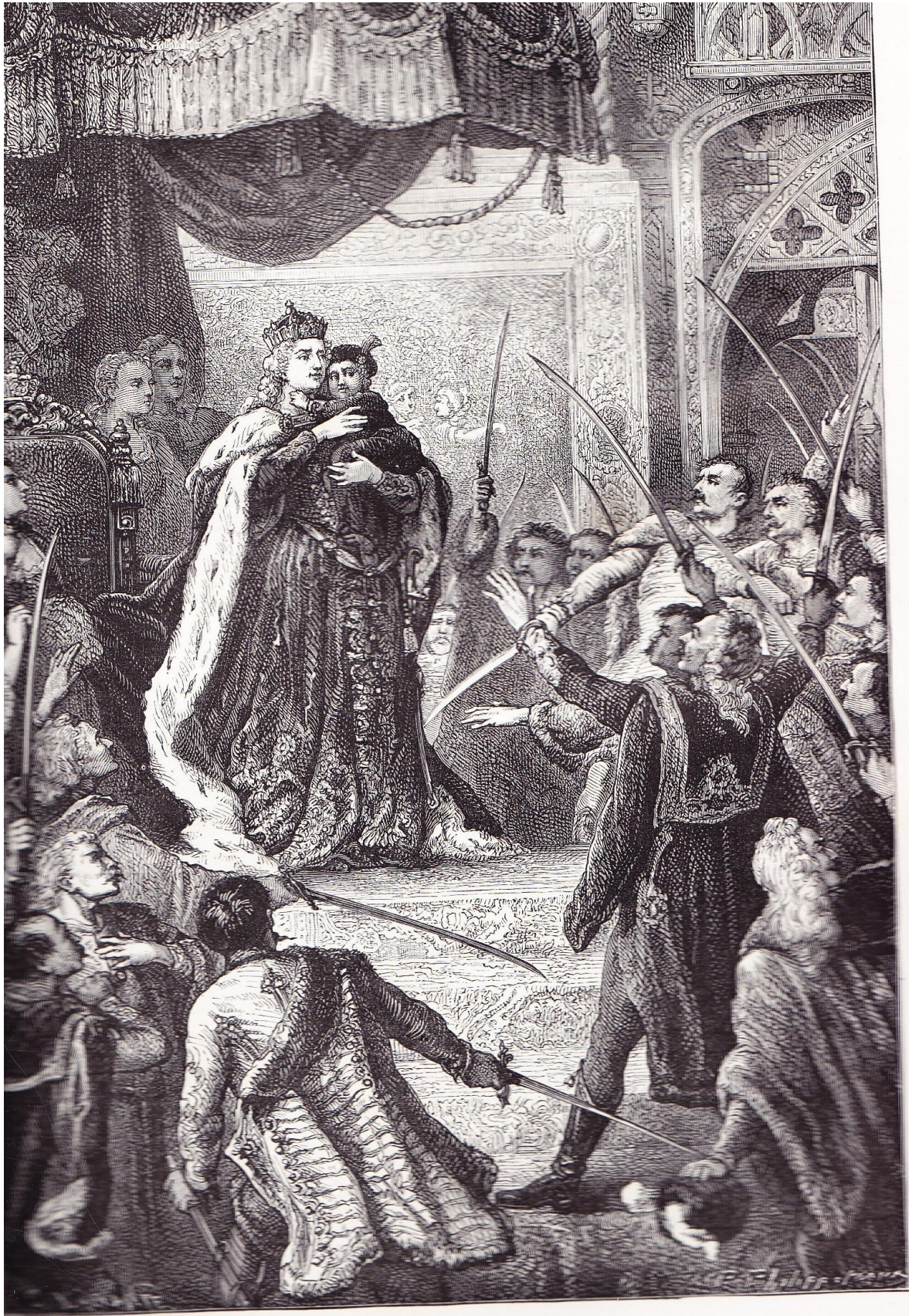
MARIE-THÉRÈSE À L'ASSEMBLÉE DES MAGNATS

« Marie-Thérèse à l'assemblée des Magnats »