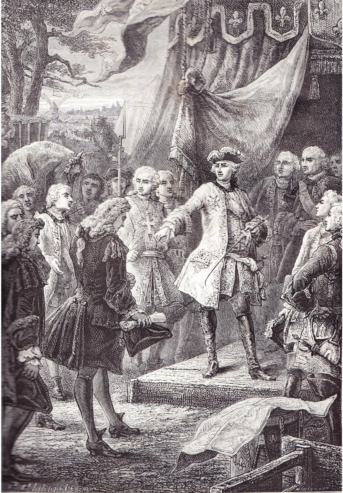
LOUIS XV ET L'AMBASSADEUR DE HOLLANDE

« Louis XV et l'ambassadeur de Hollande »